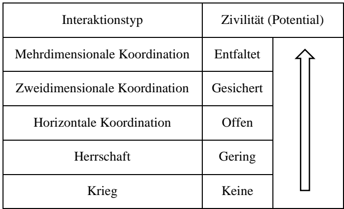
Tabelle 2: Zivilitätspotentiale von Interaktionstypen

Nach diesem Modell lassen sich qualitative Handlungstypen quantifizieren – eine sozialwissenschaftliche Perspektive.