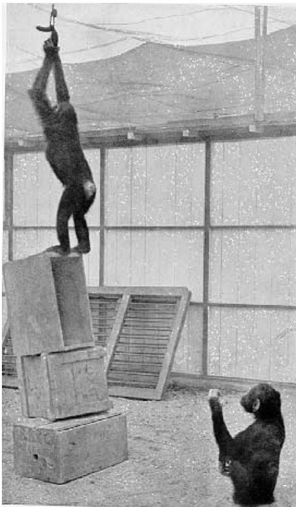
Bild 1 Eine „Intelligenzprüfung am Menschenaffen“ (Köhler, 1917).

in die Ecke. In einer anderen Ecke des Käfigs steht eine Holzkiste. Köhler beschreibt, dass nach einiger Zeit der Blick der Schimpansin zwischen Banane und Kiste wechselt, sie dann zielgerichtet zur Holzkiste läuft, diese unter die Banane zieht, darauf steigt und zugreift.