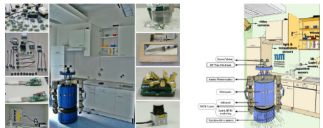
Bild 2 Forschung an integrierten, kognitiven Systemen in der Gruppe um Prof. Beetz (Beetz et al., 2008).

siehe auch die Diskussionen zum Lernen auf Systemebene (Thrun, 2000; Andre and Russell, 2001)).