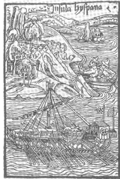
Holzchnitt aus dem lat. Kolumbusbericht (1493)

Esse non longe ab illis insulis quorundam ferorum hominum insulas, qui carnibus humanis vescantur, fama didicere; id esse causae, quod ita trepidi adventantes nostros confugerent, postea rettulerunt, Canibales arbitrati: sic truculentos illos sive Caribes vocant.