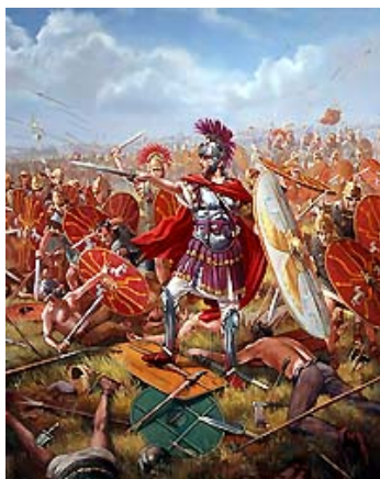
Caesar in einer Schlacht

[23] His constitutis rebus nactus idoneam ad navigandum tempestatem tertia fere vigilia solvit equitesque in ulteriorem portum progredi et naves conscendere et se sequi iussit. A quibus cum paulo tardius esset administratum, ipse hora diei circiter quarta cum primis navibus Britanniam attigit atque ibi in omnibus collibus expositas hostium copias armatas conspexit. Cuius loci haec erat natura atque ita montibus angustis mare continebatur, uti ex locis superioribus in litus telum adigi posset. Hunc ad egrediendum nequaquam idoneum locum arbitratus, dum reliquae naves eo convenirent, ad horam nonam in ancoris expectavit. Interim legatis tribunisque militum convocatis et, quae ex Voluseno cognovisset et quae fieri vellet, ostendit monuitque, ut rei militaris ratio maximeque ut maritimae res postularent, ut, quam celerem atque instabilem motum haberent, ad nutum et ad tempus omnes res ab iis administrarentur. His dimissis et ventum et aestum uno tempore nactus secundum dato signo et sublatis ancoris circiter milia passuum septem ab eo loco progressus aperto ac plano litore naves constituit.