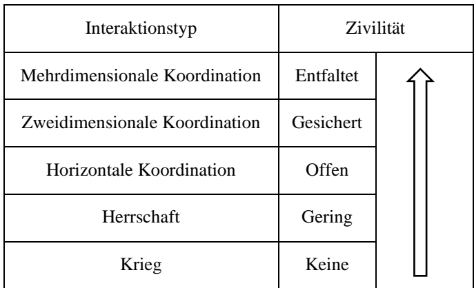
Tabelle 2: Zivilitätspotentiale von Interaktionstypen

Nach diesem Modell lassen sich qualitative Handlungstypen quantifizieren – eine sozialwissenschaftliche Perspektive.